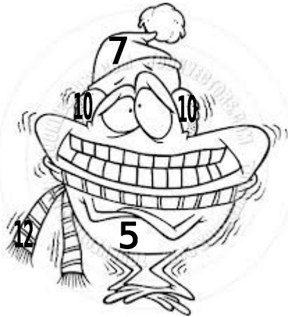
Il fait froid